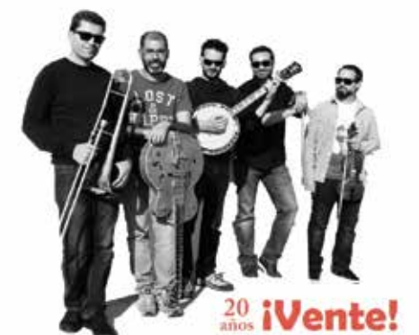
20 años ¡Vente!